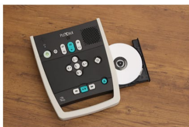
デジ図CDから内蔵メモリにバックアップ